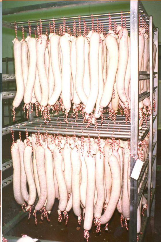
BASTIDOR 63 PIEZAS 4+3+4 BARRAS - 6+5+6 GANCHOS/BARRA BASTIDOR 68 PIEZAS 4+4+4 BARRAS - 6+5+6 GANCHOS/BARRA